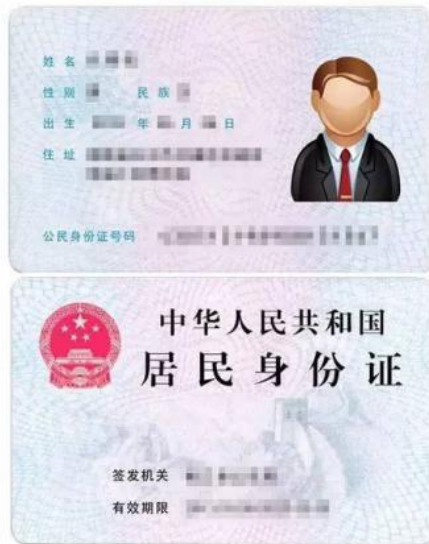
图 3 身份证照片示例图