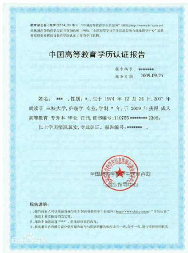
图6 教育部学历认证报告照片示例图