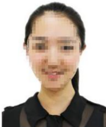
图 2 准考证照片示例图

● 能如实地反映本人近期相貌，照片内容要求真实有效，不得做任何修改（未经过 PS 等照片编辑软件处理，不得用照片翻拍）。