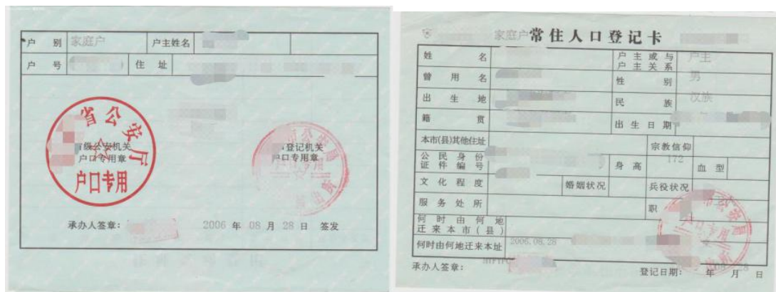
图 9 户口本照片示例图