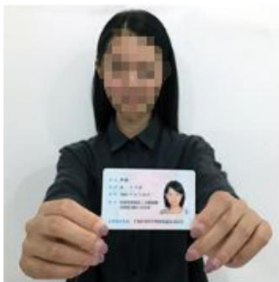
图 4 手持身份证照片示例图