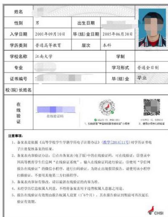
图5 教育部学历证书电子注册备案表照片示例图