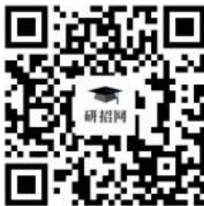
图 1 网上确认入口二维码