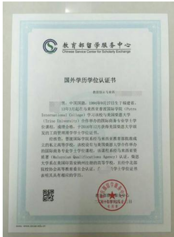
图 8 教育部留学服务中心出具的认证报告照片示例图